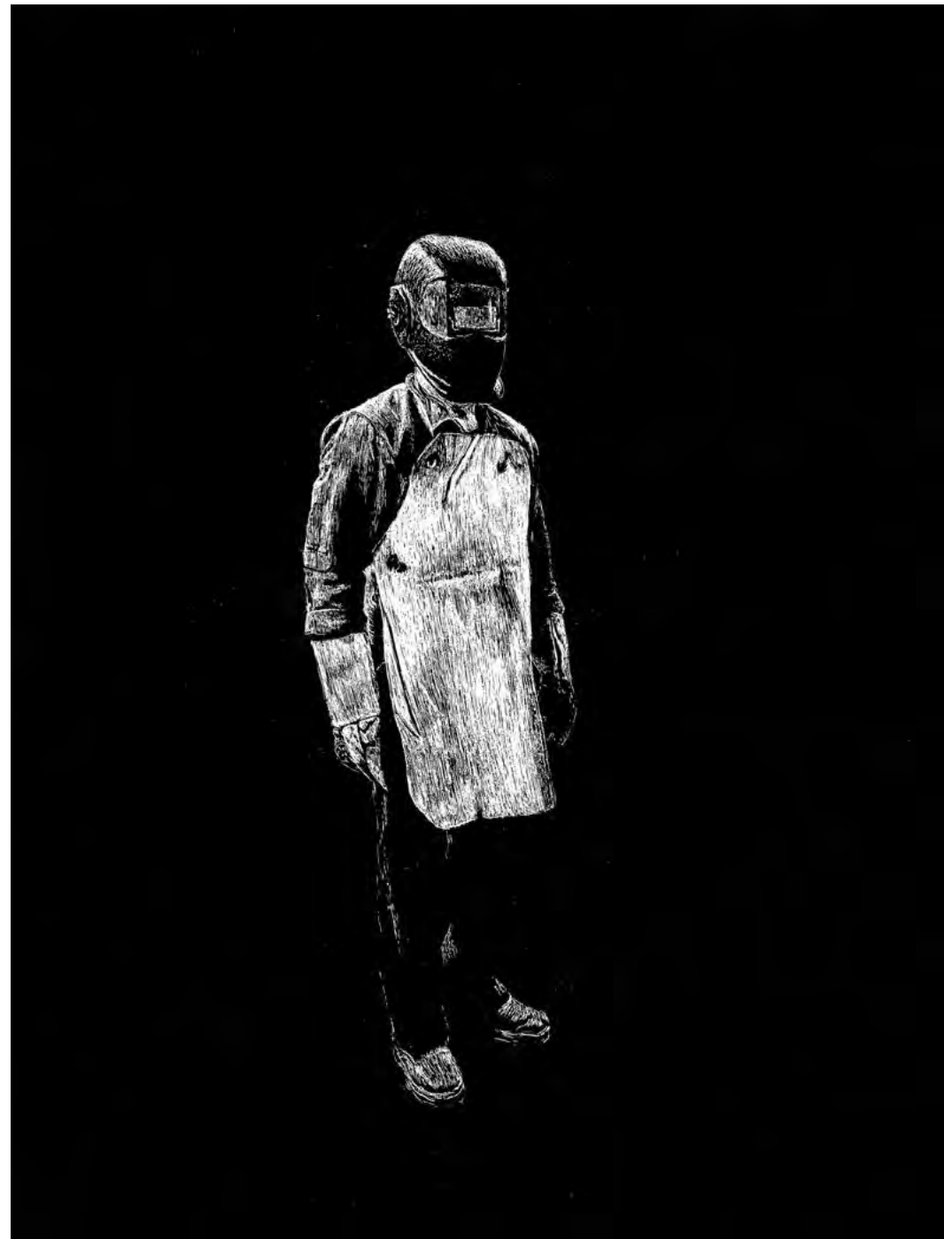
El hombre que no pudo reparar un sueño II, 2022 Scratchboard. 40 x 27 cm