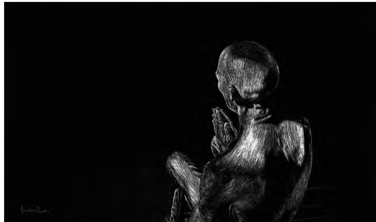
Creyente II, 2023 Scratchboard. 30 x 50 cm