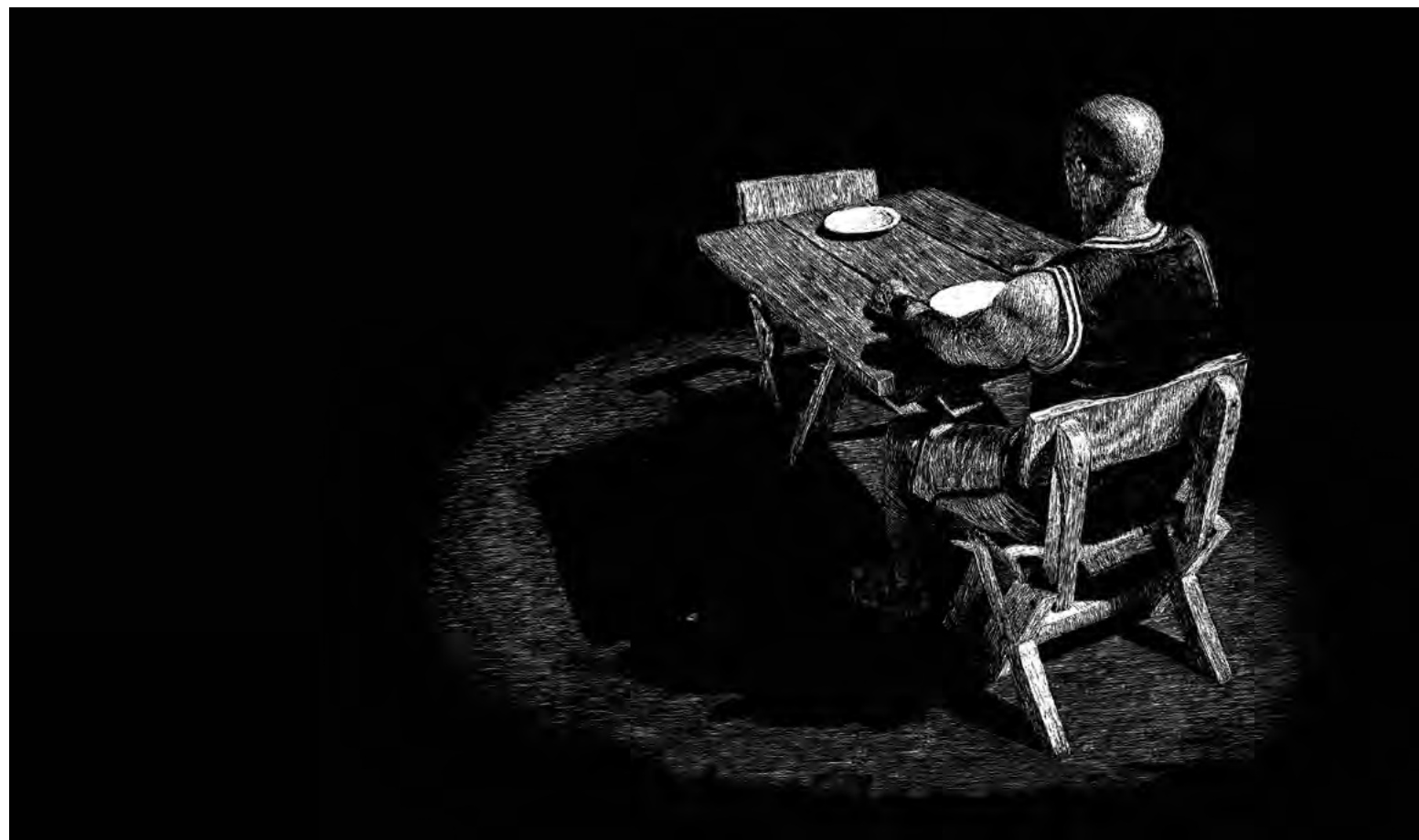
14 de febrero, 2023 Scratchboard. 30 x 50 cm