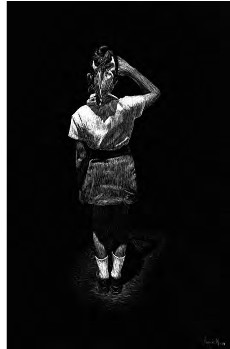
Ser como quien , 2024 Scratchboard. 50 x 30 cm