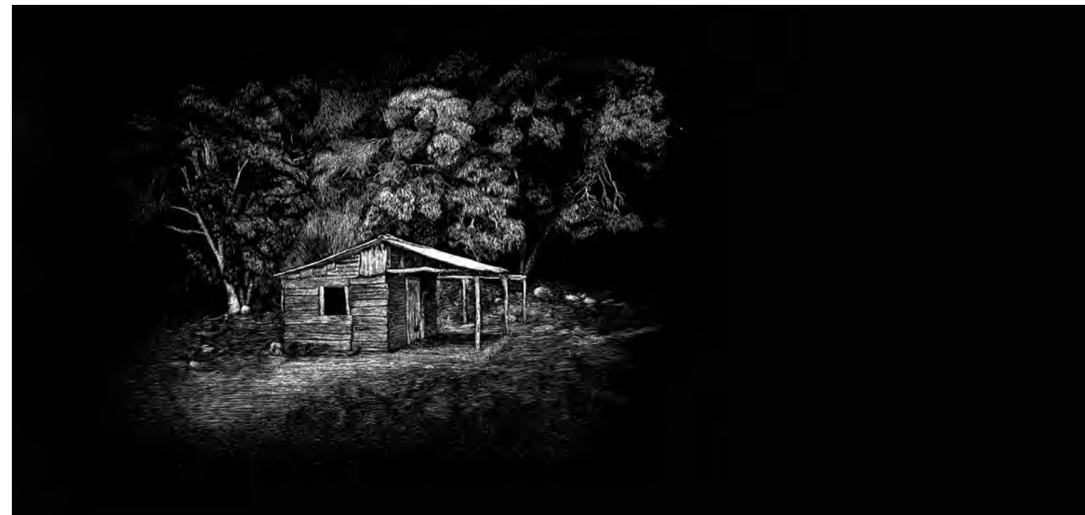
Fiesta en la campiña, 2023 Scratchboard. 30 x 50 cm