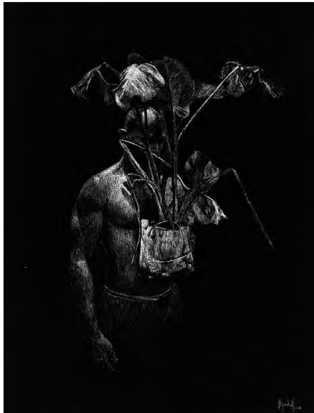
Tierra y alma , 2024 Scratchboard. 40 x 27 cm