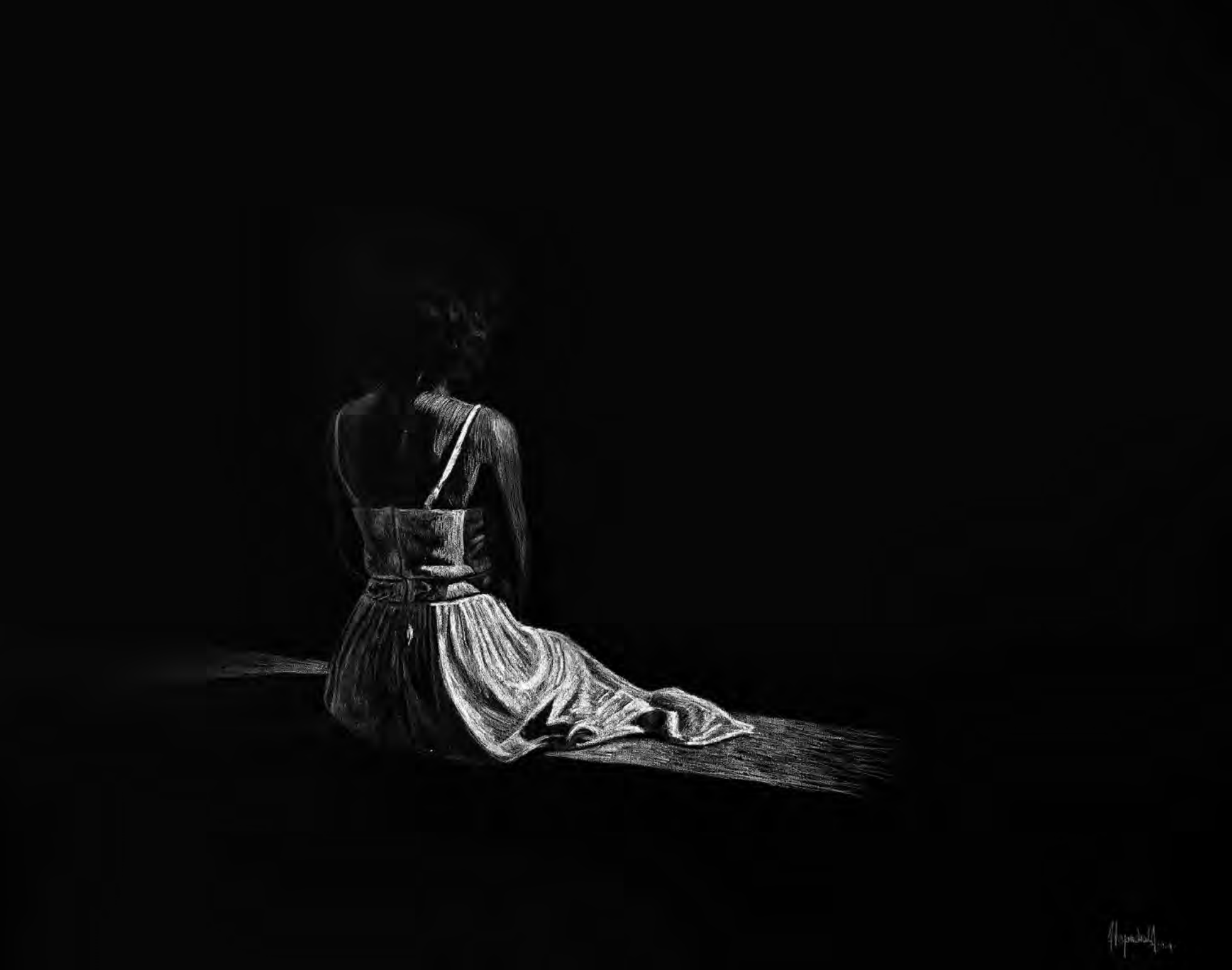
Muchacha frente a paisaje cubano II, 2024 Acrílico, pastel blanco sobre lienzo. 140 x 160 cm