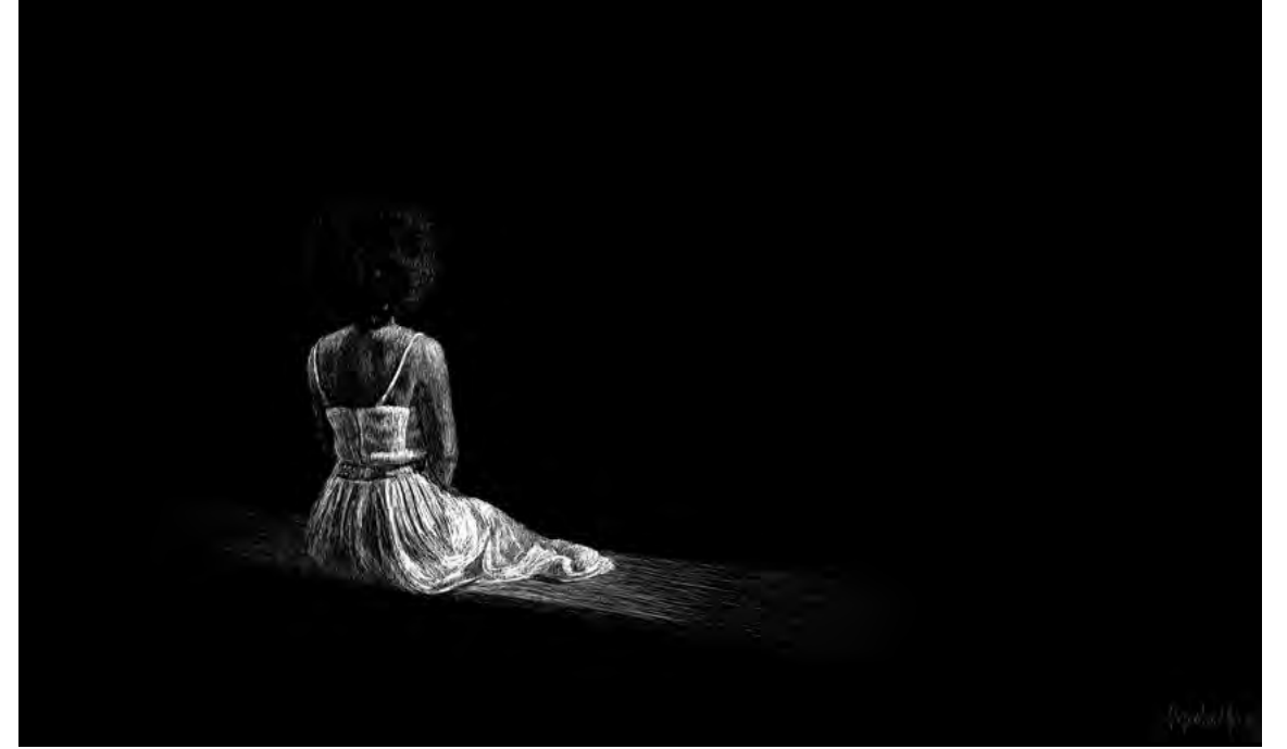
Muchacha frente a paisaje cubano, 2024 Scratchboard. 30 x 50 cm