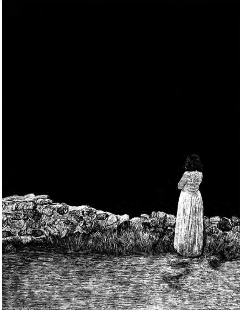
Regreso a la nada, 2022 Scratchboard. 40 x 27 cm