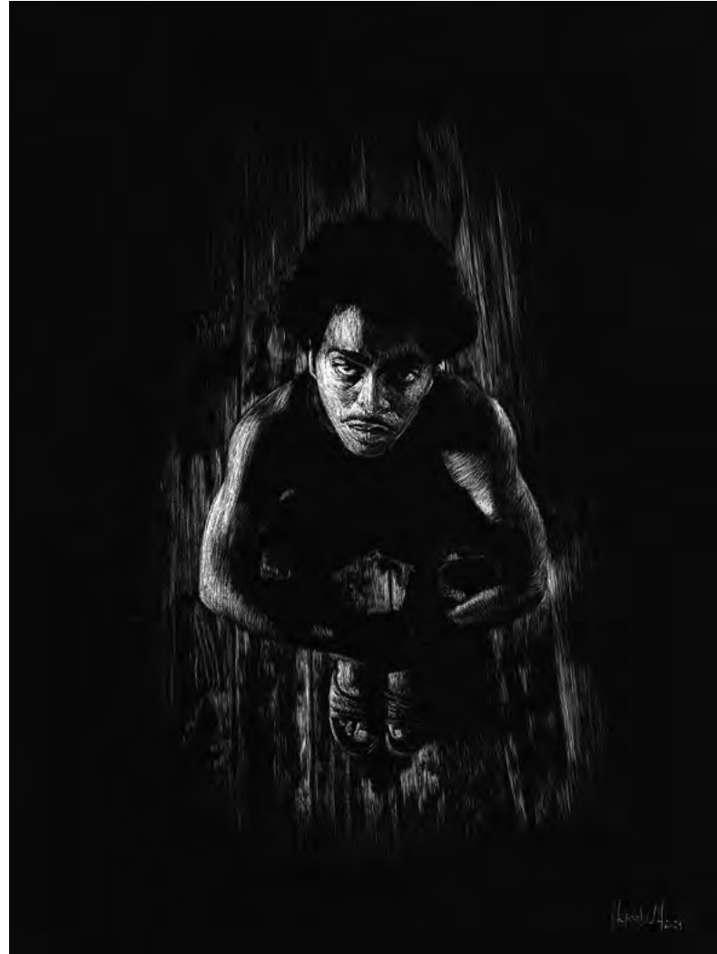
Sin respuestas, 2024 Scratchboard. 30 x 23 cm